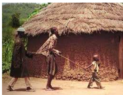
多くの人達が視力を失った