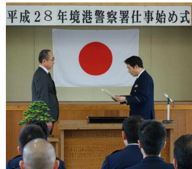
平成28年境港警察署仕事始め式