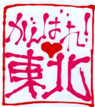
境港ライオンズクラブ