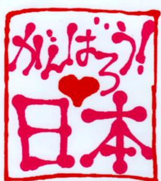
境港ライオンズクラブ

東日本大震災によりお亡くなりになられた方々のご冥福を謹んでお祈り申し上げますと共に、被災された皆様や原発事故で避難を余儀なくされている皆様に心からお見舞い申し上げます。