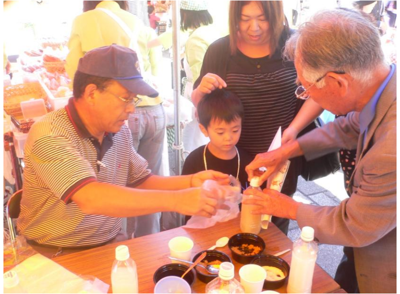
EM水石けん製作体験 上手に出来たかな?